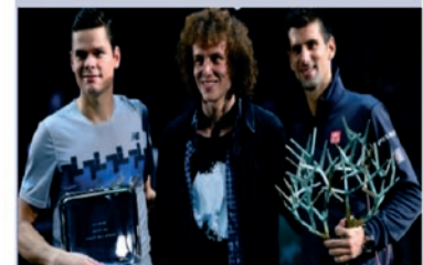
Djokovic vainqueur du tournoi contre Raonic 6/2 6/3 en finale