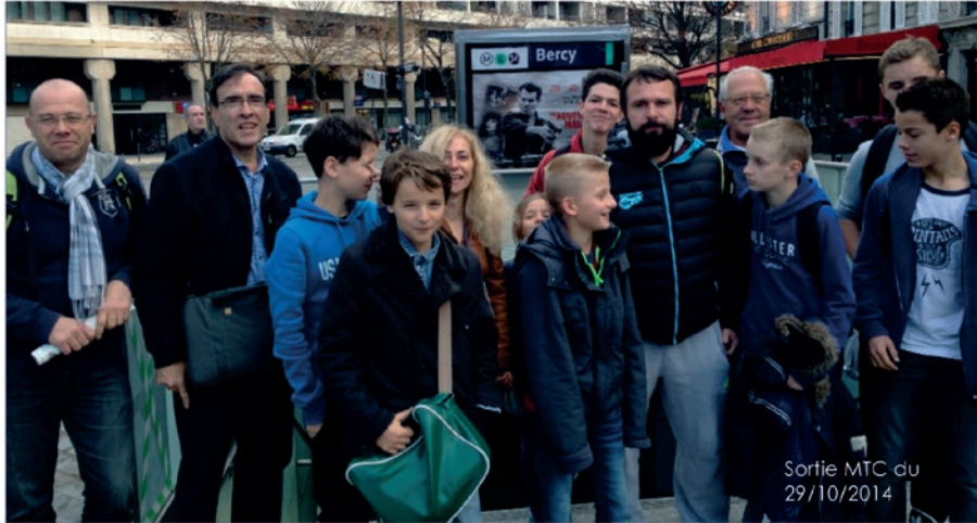
Sortie MTC du 29/10/2014