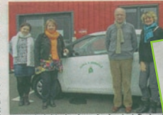
Une partie de l'équipe du service de soins infirmiers à domicile de Méré et de l'équipe spécialisée Alzheimer.

À l'ADMR, l'ADMR cherche à recruter au moins deux personnes trentaines de salariés. «Nous Sécurité sociale.